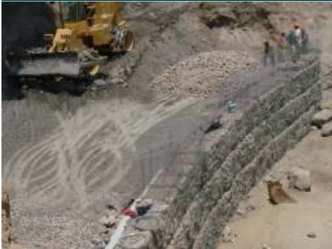
Durante la obra