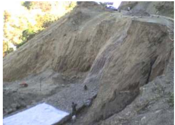
Durante la obra