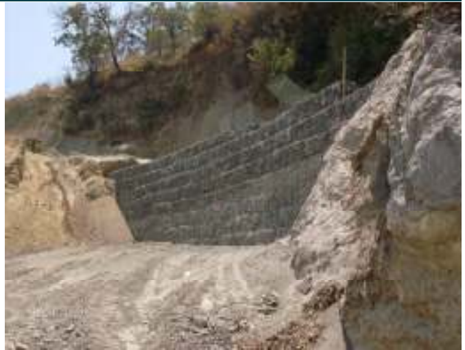
Durante la obra