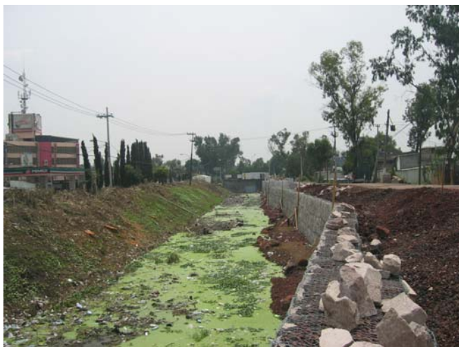
Durante la obra