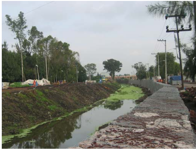
Durante la obra