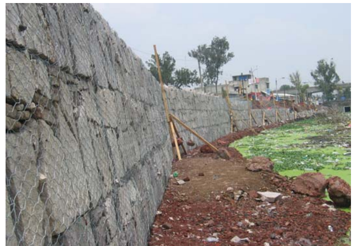
Durante la obra